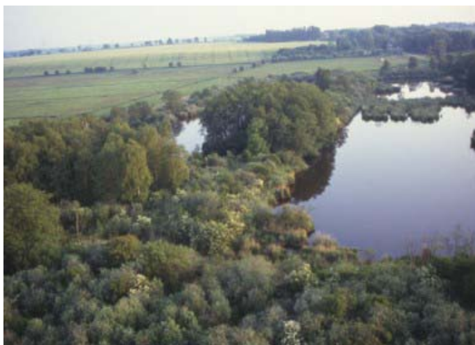
Abbildung 3: Das NSG Peenetal bei Gützkow