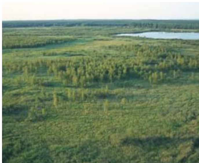
Abbildung 2: Das NSG "Ahlbecker Seegrund" in der Grenzheide